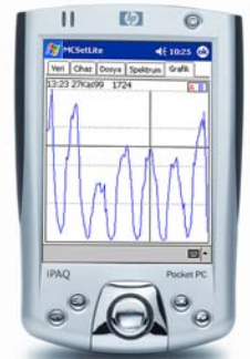
MCSetLite que funciona en una PC de bolsillo con los ajustes turcos de la lengua.

La intuitiva interface de MCSetLite es muy fácil y rápida de aprender; y como las unidades solo guardan información de ejes individuales, no hay parámetros difíciles de configurar. No es necesario configurar ningún parámetro de casilleros de velocidad, intervalos de tiempo ó esquemas de clases. Esta es la filosofía básica de MetroCount – darle al usuario eficiencia y rápida instalación.