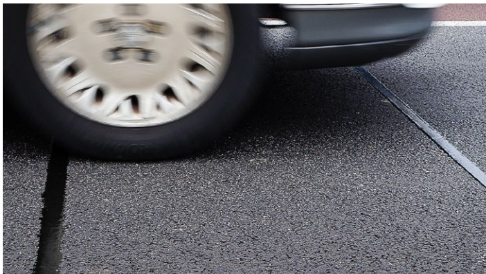
Integración de bajo perfil.