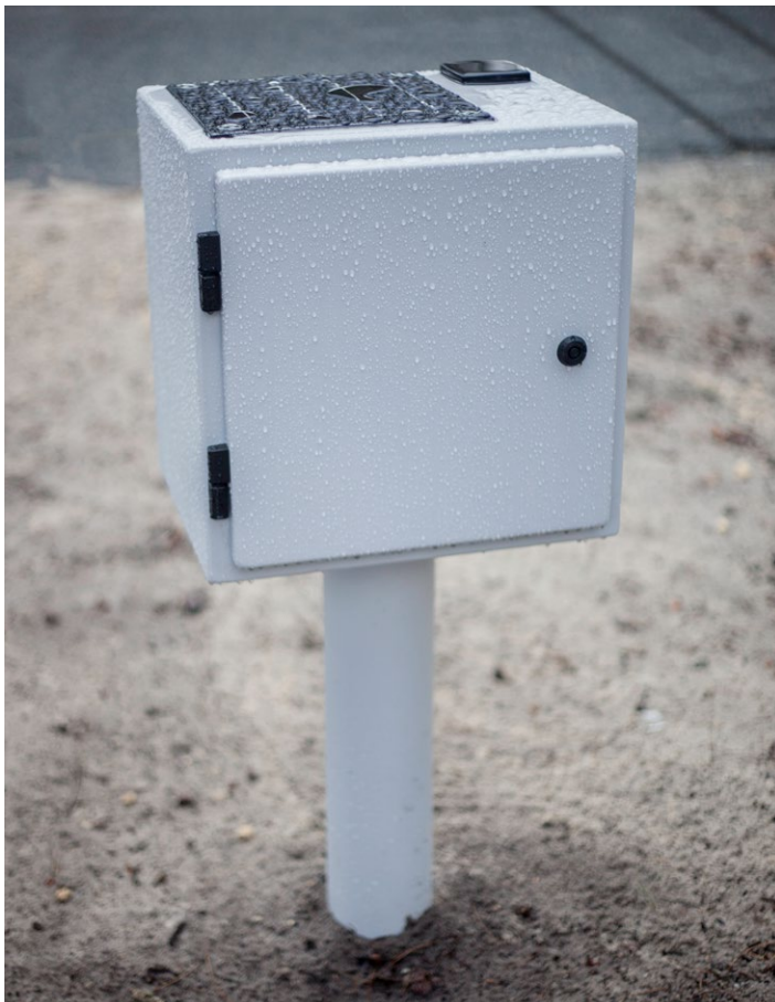
Caja a prueba de agua con antena 3G y panel solar.

Complementos: Módulo de acceso remoto FieldPod®